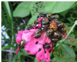
Attacco su rosa

Per gli ingenti danni economici che può provocare Popillia japonica è considerata dalla normativa fitosanitaria un organismo nocivo da quarantena.